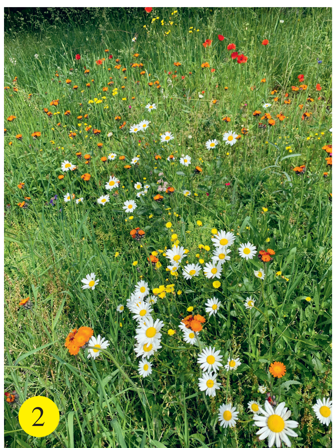
2 Prairie fleurie