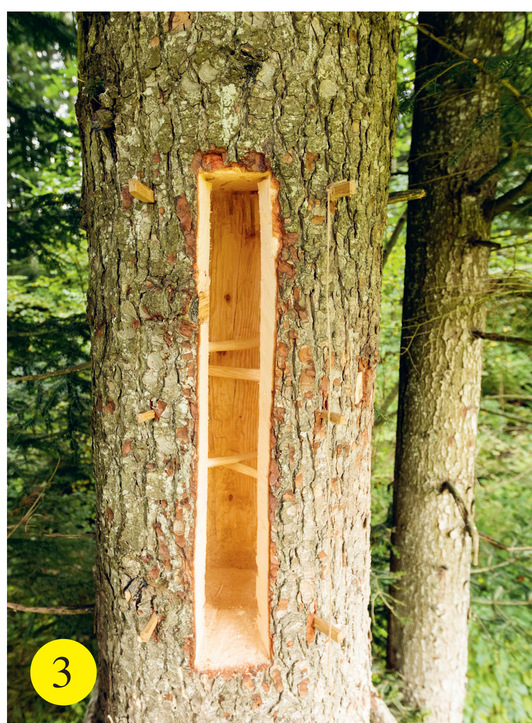
3 Cavités dans les arbres