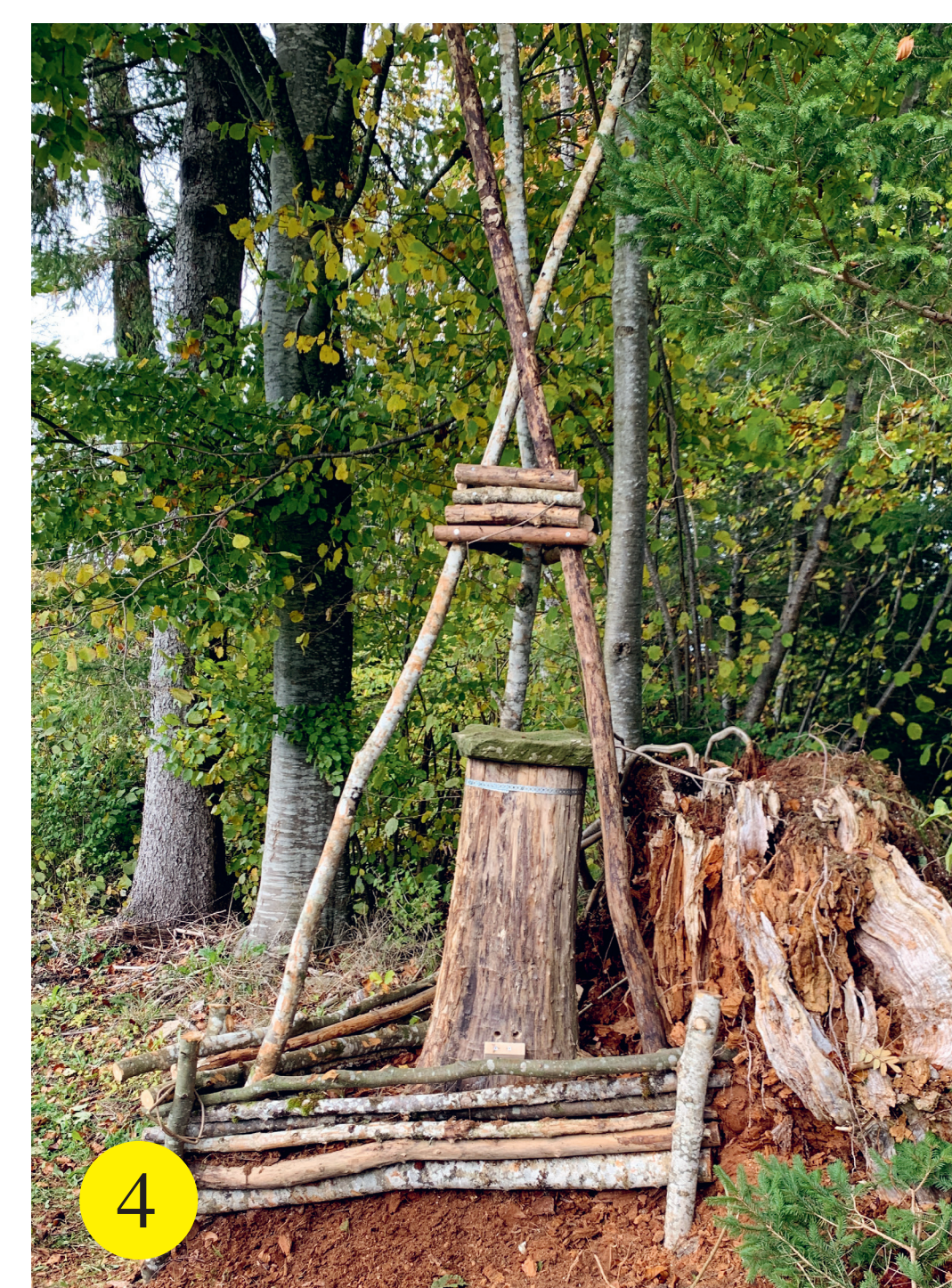
4 Habitat Abeilles & Stratiolaelaps scimitus