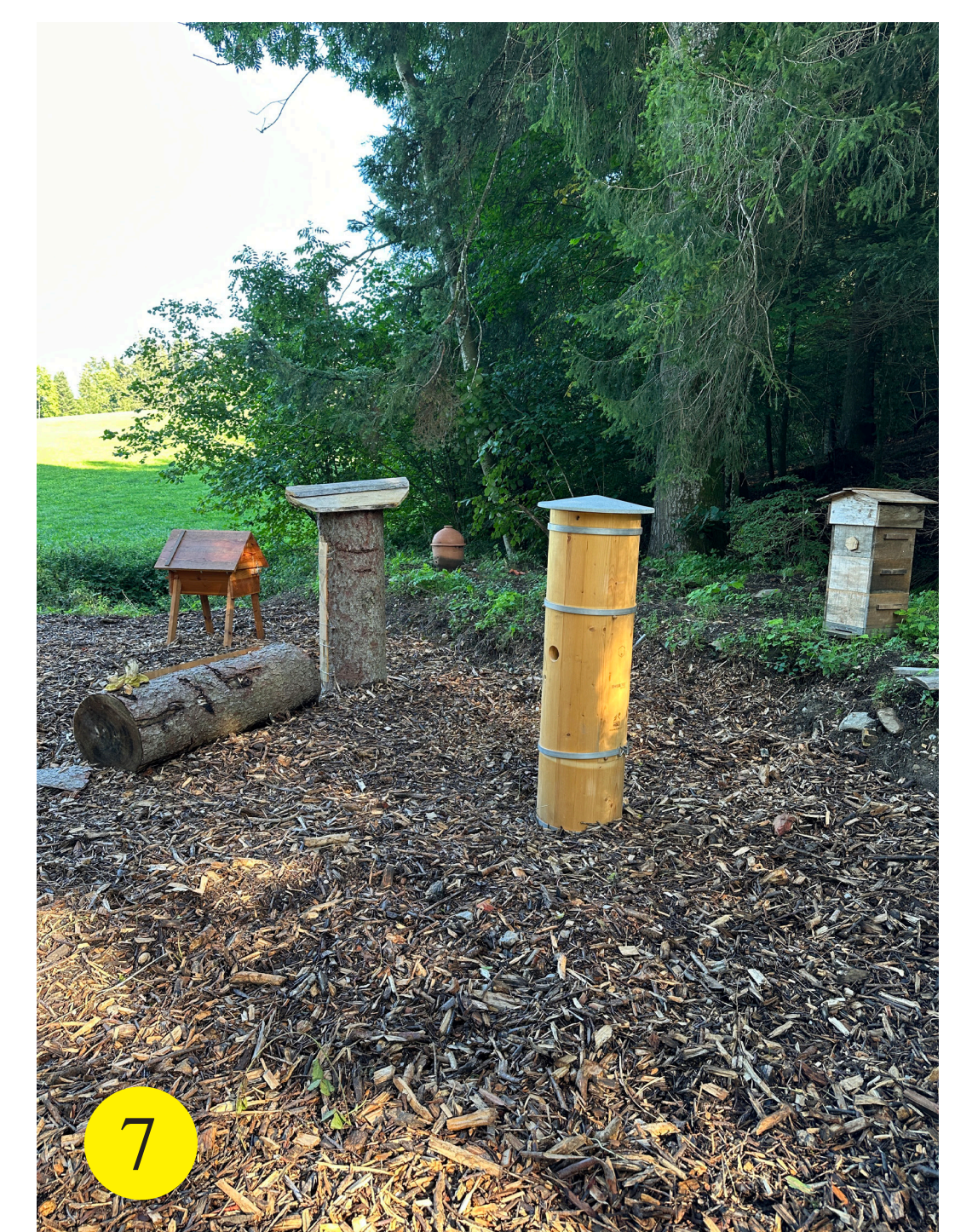
7 Exposition de ruches et d'habitats

Visite libre ou guidée gratuite selon le programme sur notre site www.freethebees.ch . Durant la visite guidée chaque enfant reçoit un cahier à compléter durant le parcours.