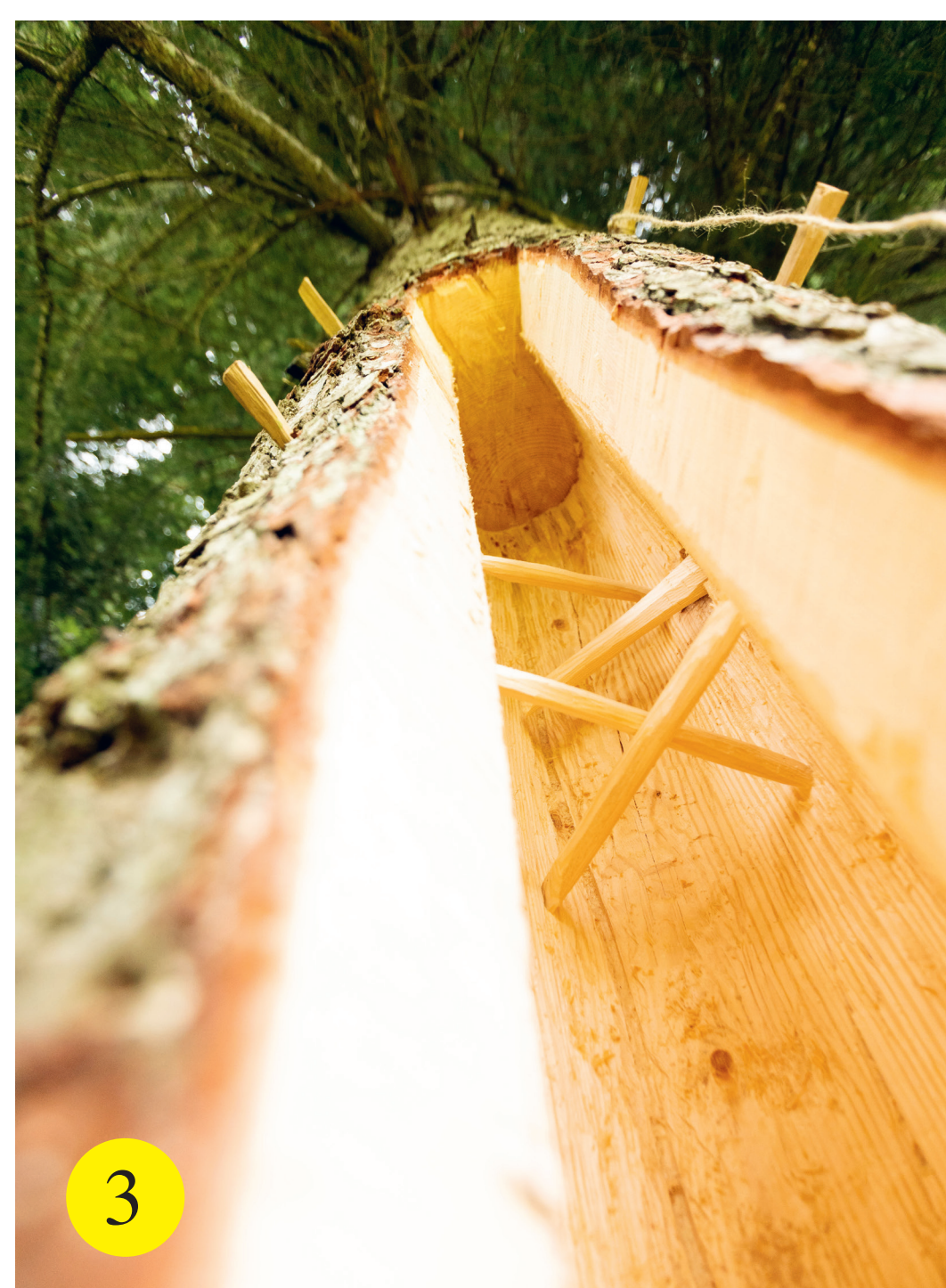
3 Cavités dans les arbres